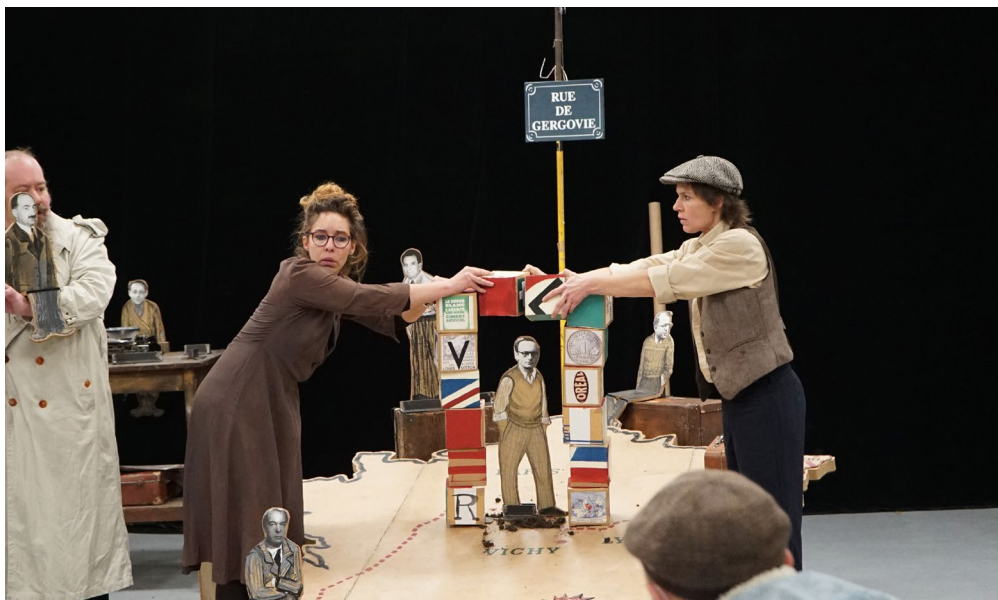
© Cécile Dechosal, Le Moulin fondu